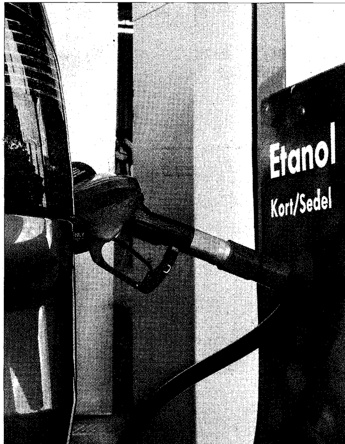
Mehr Schweizer Biotreibstoff im Tank? Vielleicht.