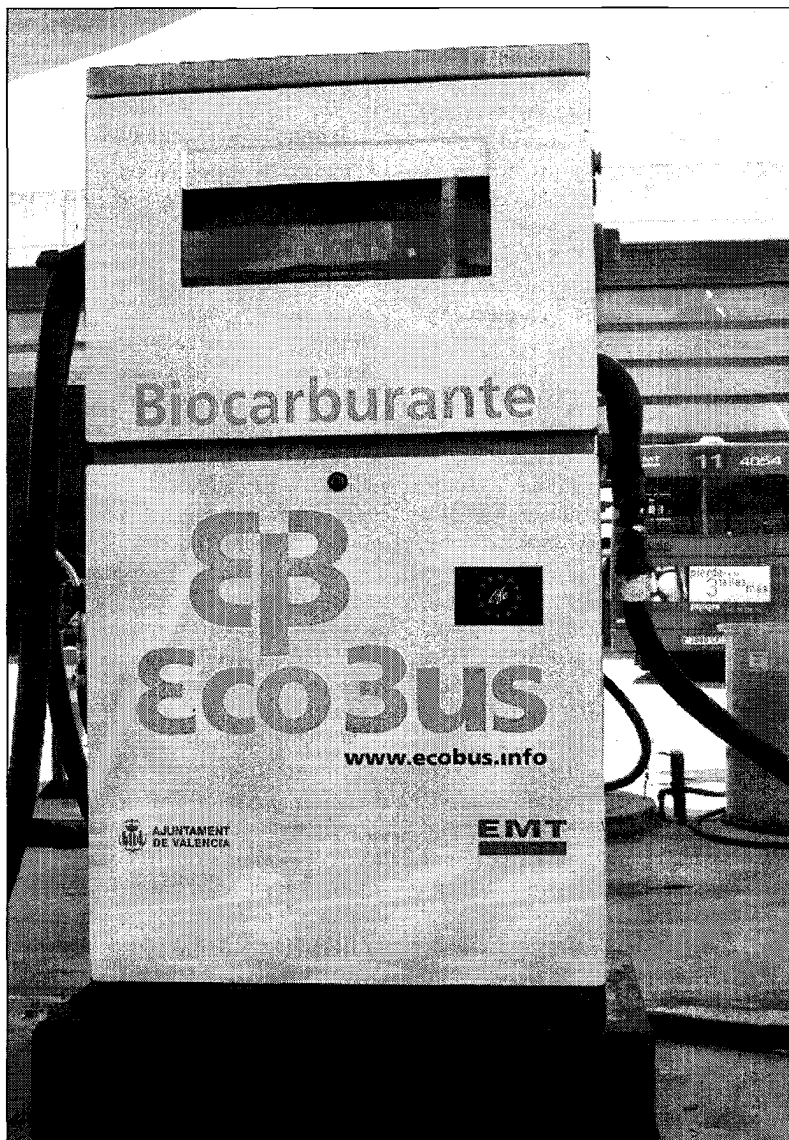
Biocarburant ei ina dallas energias dil futur. Era per l'agricultura svizra sedattan sut cir- cumstanzias novas perspectivas. 10

En Brasilia carrescha gia oz la pluralitad dils 20 milliuns autos cun ina mischeida da 25% etanol ord canna da zu- cher. Adina dapli autos van denton gia cun 100% etanol che cuosta leu mo la mesadad dil prezi da benzin e ch'ins sur- vegn en Brasilia dapertut. Brasilia vul proviantar el futur era l'India e la Chi- na, il Giapun e la Corea cun etanol. La Brasilia vala gia oz tier ils commerciants d'etanol sco la «Saudi Arabia digl eta- nol».