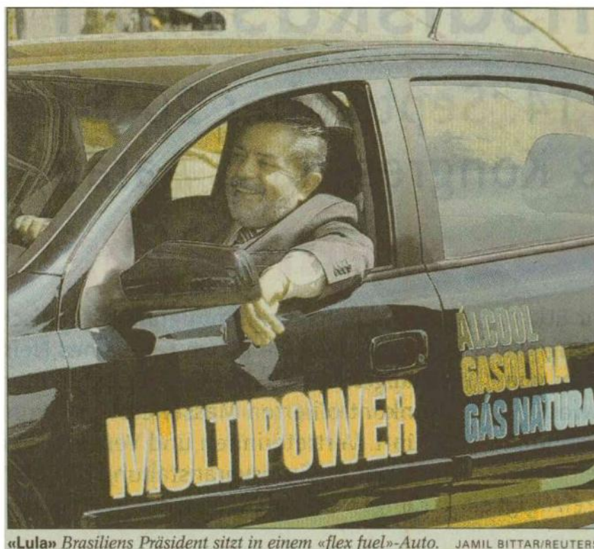
«Lula» Brasiliens Präsident sitzt in einem «flex fuel»-Auto.

Während Europa und die USA erst zögerlich experimentieren, kennt die brasilianische Begeisterung für alternative Treibstoffe keine Grenzen. Anfang Jahr präsentierte der staatliche Flugzeugbauer Embraer das erste serienmässig hergestellte alkoholbetriebene Kleinflugzeug. 2005 soll der erste wasserstoffbetriebene Bus auf den Strassen rollen. «Egal ob die Autos mit Wasserstoff, Alkohol oder Biodiesel fahren», meint der Analyst Andres Oppenheimer. «Es ist auf jeden Fall absurd, dass Bush 80 Mrd. Dollar pro Jahr für Irak ausgibt und nur 360 Mio. für die Entwicklung eines Wasserstoffautos.»