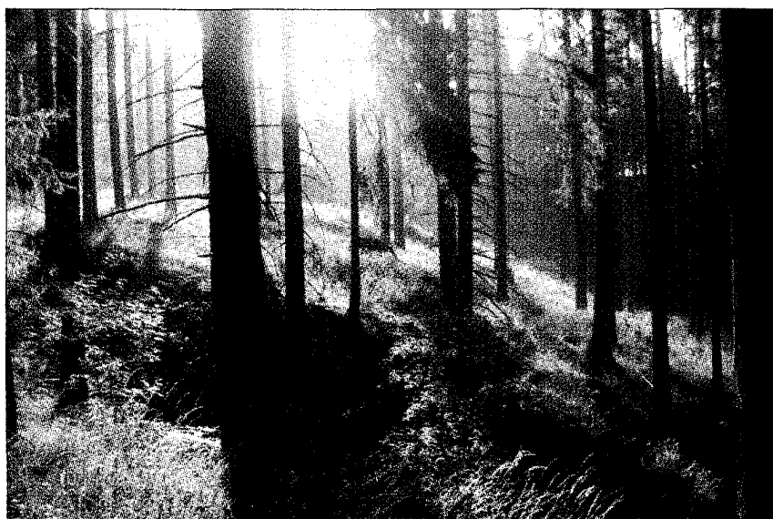
Holz und Stroh: Sie sind mögliche Rohstoffe für synthetische Biotreibstoffe.