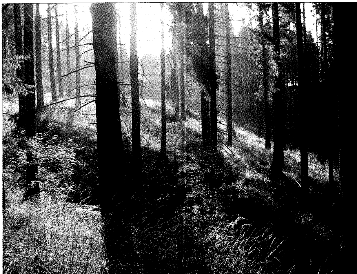
Holz und Stroh sind mögliche Rohstoffe für synthetische Biotreibstoffe. Aus Überschussgetreide kann Bioethanol und aus Raps Biodiesel hergestellt werden.