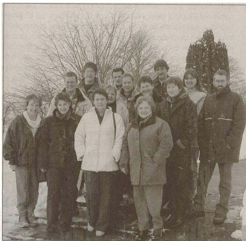
LE GROUPE de paysannes et paysans faisant partie du comité du Cercle agricole de Delémont.