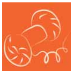
Le fil rouge