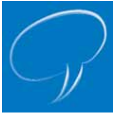
Le mot du Président